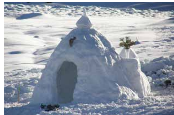
Construction et nuit en igloo.

Si vous préférez loger en vallée vous pourrez découvrir le charme traditionnel des gîtes ruraux et des chambres d'hôtes dans les petits villages de montagne.